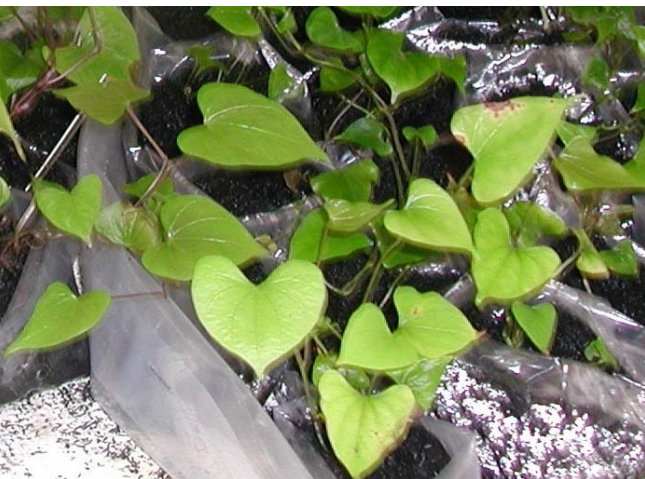
Rop blo waelou i kro long plastik bag long neseri