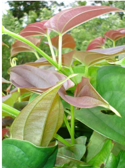
Yang helti rop blo yam blo katem